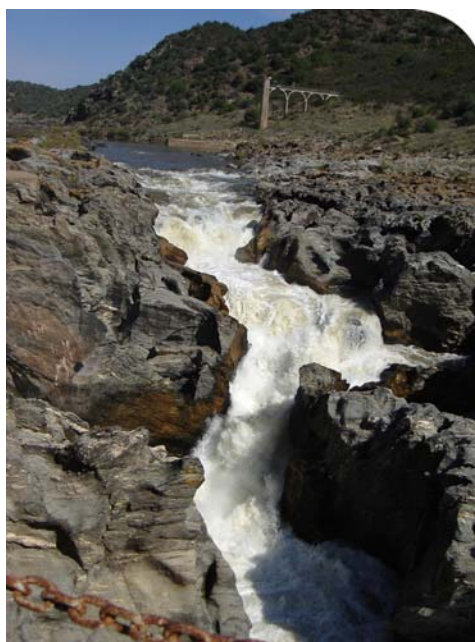
Pulo do Lobo

Nos cursos de água afluentes – ribeira de Terges e Cobres, Oeiras, Carreias e Vascão – surge uma vegetação ribeirinha diversificada e adaptada ao regime torrencial dos caudais.